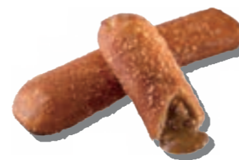
究極のカレーパン