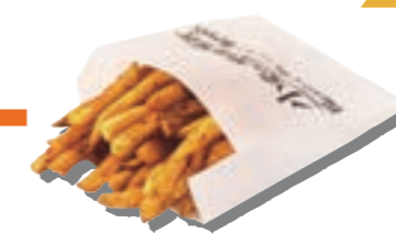
オリジナルポテトフライ