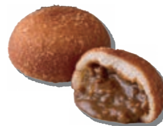
禁断のカレーパン